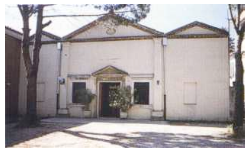
Chiesa di San Francesco