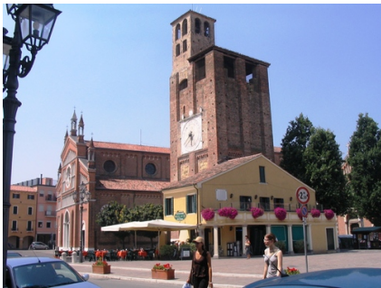
Duomo di Piove di Sacco