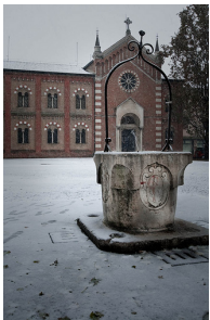
Chiesa dei Penitenti