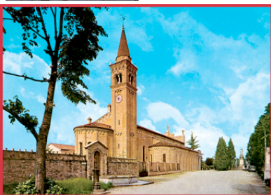
Santuario della Madonna delle Grazie