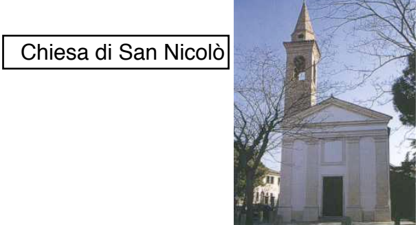
Chiesa di San Nicolò